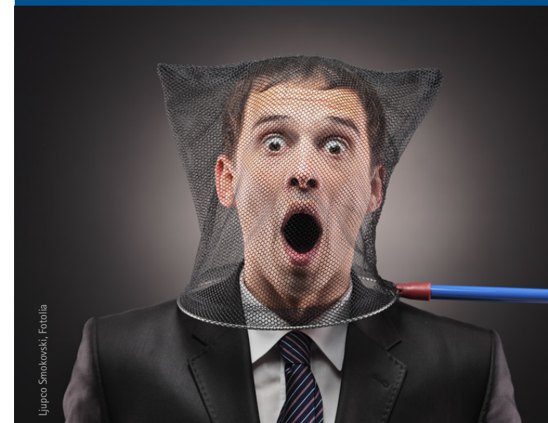
Ljupco Smokovski, Fotolia